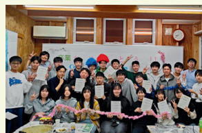
中3卒業お祝いパーティー