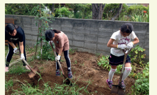
菜園での野菜作り